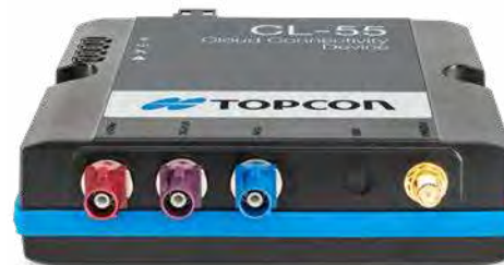
CL-55 Modem de connectivité Cloud