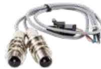
3 Capteur optique Capteur optique pour la précision et la fiabilité