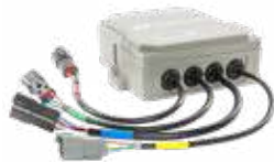
2 Contrôleur Contrôleur YM-1 pour une fiabilité éprouvée