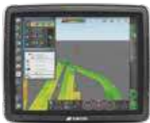
1 Écran tactile Topcon X25 et X35