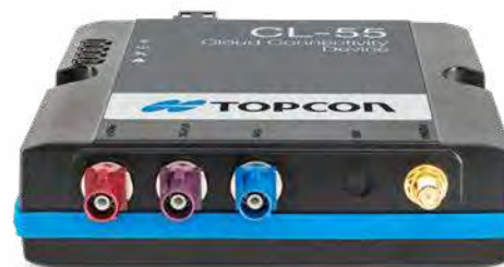
CL-55 Modem de connectivité Cloud