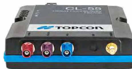
CL-55 Modem de connectivité Cloud