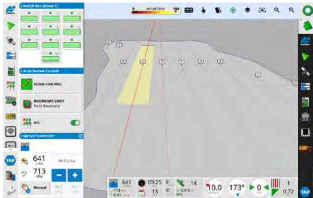
Horizon OS ex : contrôle automatique de sections