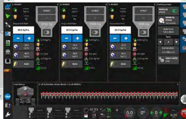
Horizon OS, ex : régulation de pulvérisation