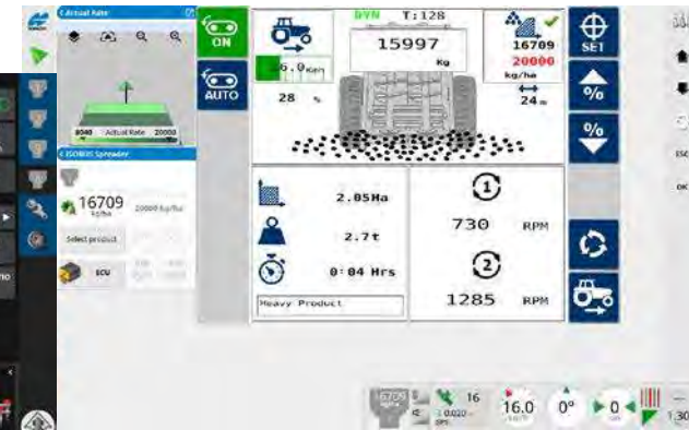
Horizon OS / ISOBUS ex : Guidage et régulation d'épandage de matière organique